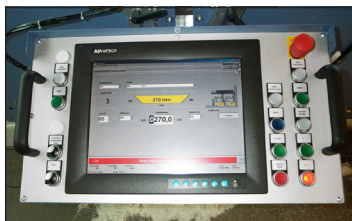
PC-Steuerung mit Touchscreen