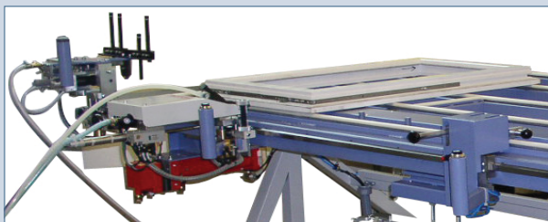
FMS 2713-A s možnosťou voľby skrutkovacej jednotky a lisovacích nožníc