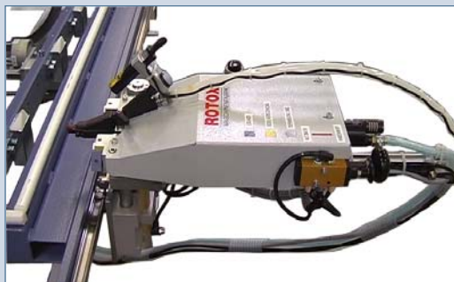
Pojazdná skrutkovacia jednotka