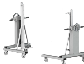
Opcia: Transport-stojan na valcovanie