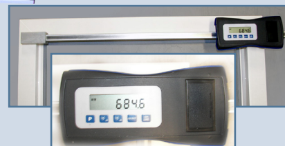
Elektronska mjerna letva 393x sa zaslonom