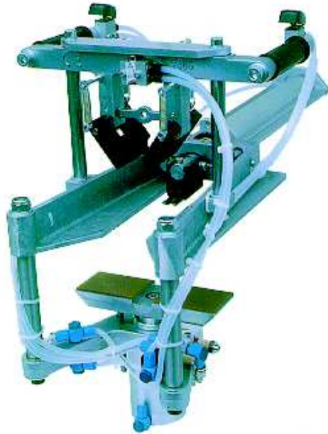
Ein Produkt der Firma Zierke