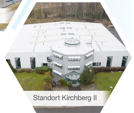
Standort Kirchberg II