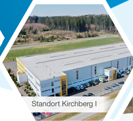
Standort Kirchberg I